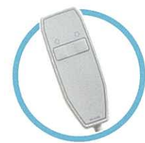
2つのボタンで 簡単操作