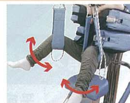
股関節の開閉運動