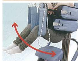
腰椎・骨盤の回旋運動