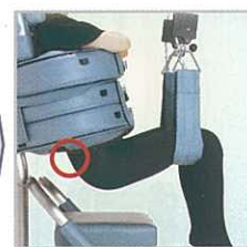
牽引しない牽引(免荷)