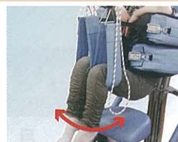
膝関節の屈曲・伸展