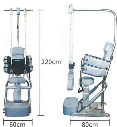
従来のベッド型牽引機と比較して、 1/3のスペース(新聞紙1枚分)に設置可能

効果あり群は65.7%(23/35名)であった。急性腰痛症は69.2%(18/26名)、慢性腰痛症は55.6%(5/9名)に改善を認め、両者に有意差は無かった。FFDは効果あり群で平均 9.96 \pm 5.56 cm、効果なし群で 4.63 \pm 5.14 cm。効果あり群で有意な改善を認めたが、股関節屈曲角度は効果あり群で 11.09 \pm 7.97^\circ 、効果なし群で 6.25 \pm 6.78^\circ で両者に有意な差を認めなかった。