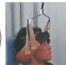
顎にかけない特許ハーネス