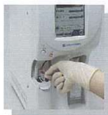
試薬をセットして血液を吸引させるだけの簡単操作