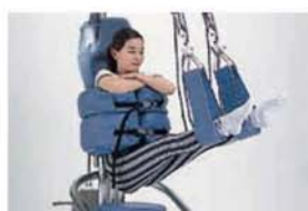
ハムストリングの伸長