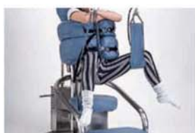
股関節の開閉運動

そこで、症状に合わせて患者さん自身で運動療法を行うことにより、腰部周辺(浅層筋から深層筋に至るまで)の血流循環を促進し、筋力・周辺組織を向上させることで、腰部から臀部・股関節の痛みを軽減させます。