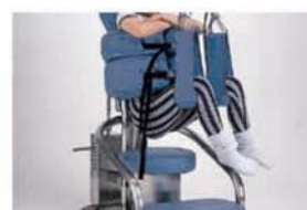
腰椎・骨盤の回旋運動