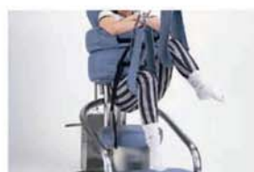
股関節の屈伸運動